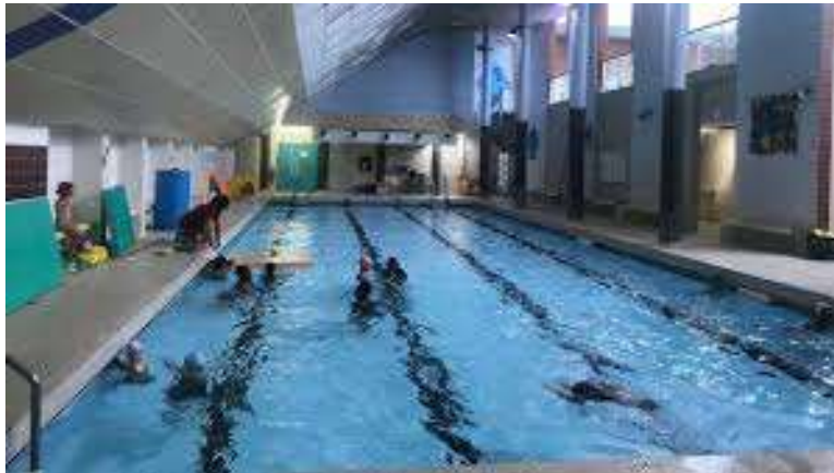
Bassin 25 m