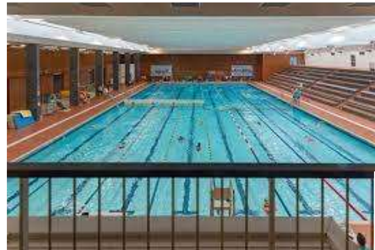
Bassin 50 m